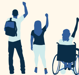
Justicia: Sin obstáculos